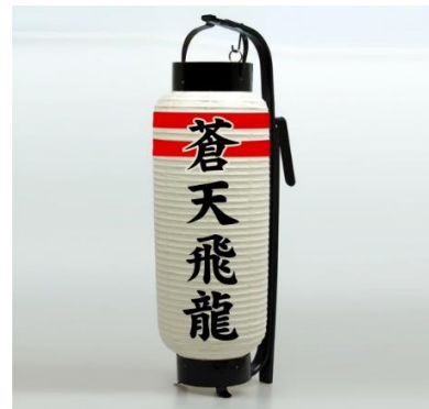
▲写真は名入れのイメージです